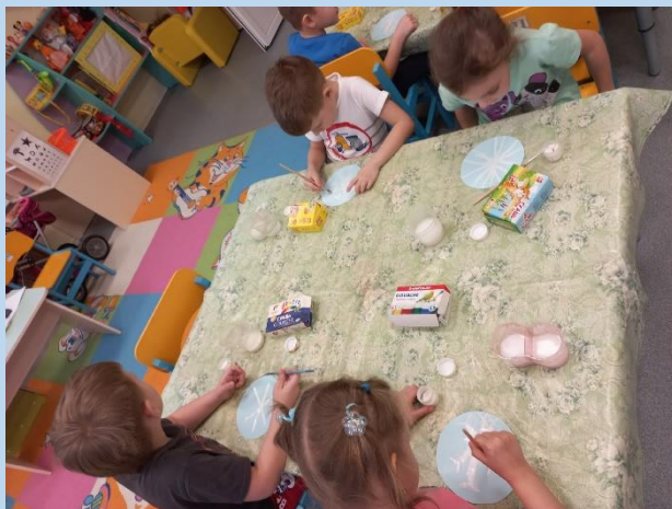
Рисование «Портрет снежинки»